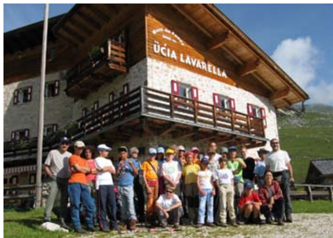
Di prima mattina davanti al rif. Lavarella in Alpe di Fanes, pronti per iniziare una giornata di fatica e di grandi soddisfazioni.

Finalmente si parte, ma i nostri guai non sono ancora finiti. Questa volta tocca ad un paio di bellissimi scarponcini, quasi nuovi, la cui suola si divide letteralmente dal resto dalla scarpa. Dopo un attimo di smarrimento generale ecco sbucare da uno zaino un paio di sandali che risulteranno provvidenziali per il prosieguo della gita. Un adulto farà il cammino con areate calzature in stile francescano, e speriamo che non piova.