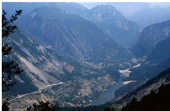
Il lago del Vajont ripreso dal sentiero del monte Toc.

In ottobre si svolgerà la tradizionale multigita aperta al gruppo giovani, agli escursionisti, ai rocciatori e free-climbers . È stata scelta la zona di Erto , teatro il 9 ottobre del 1963 di quell'immane tragedia provocata dalla frana che dal Monte Toc si è riversata nel lago del Vajont. L'ondata di piena ha mietuto quasi duemila morti tra Erto, Casso e la Valle del Piave. Sarà possibile percorrere il coronamento della diga, accompagnati dalle guide del Parco delle Dolomiti friulane o arrampicare sulle falesie o percorrere itinerari naturalistico-etnografici, come il sentiero interattivo "Erto e i luoghi del Vajont".