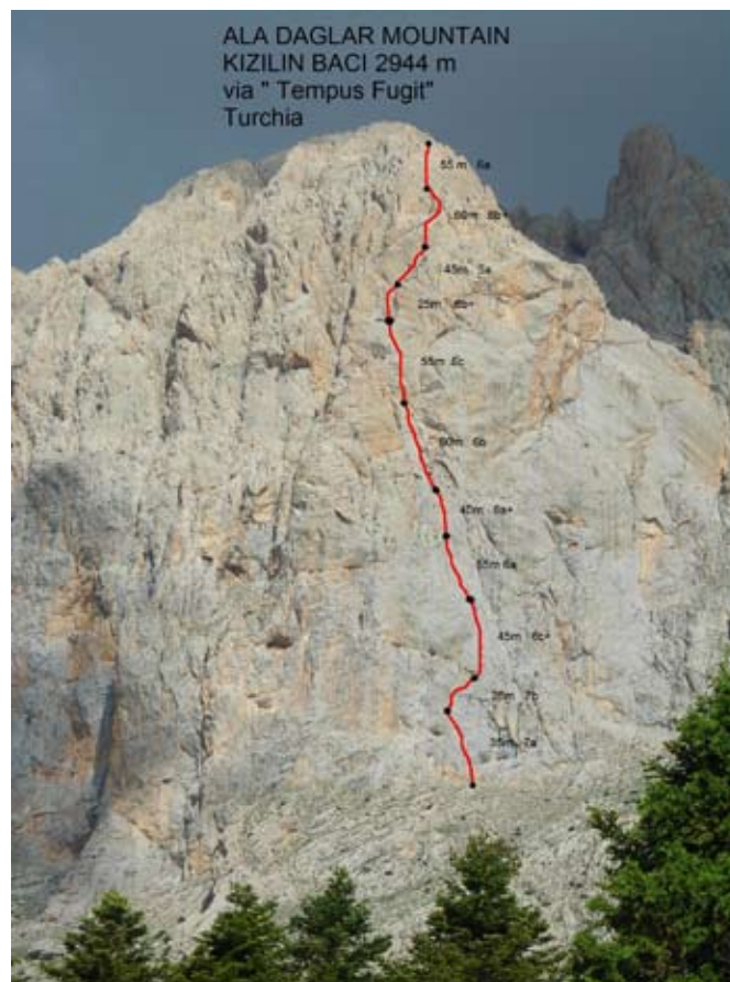
Il tracciato della via di arrampicata.