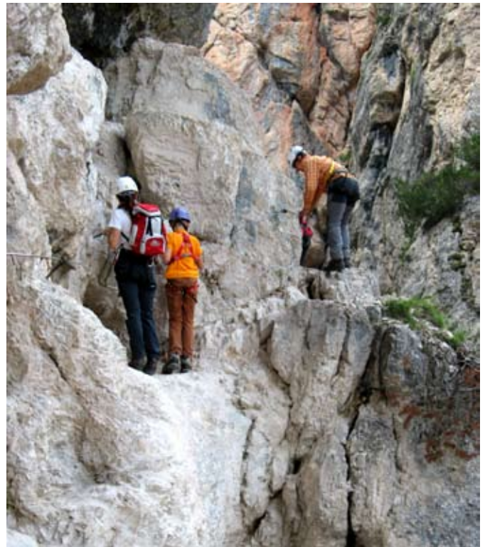
In arrampicata sul percorso attrezzato G. Barbara - L. Delaiti, che s'inoltra in una gola selvaggia, passando dietro alla cascata Valle di Fanes.

A farci dimenticare i guai ci pensa lo spettacolo naturale che si apre davanti a noi man mano che camminiamo. I fiori sono tantissimi e tutti colorati, un gruppo di cavalli mustang ci accompagna per un tratto, qualcuno si fa anche toccare, ma è meglio non avvicinarsi troppo, non si sa mai. Ad un incrocio di sentieri ci ritroviamo per un tratto con il gruppo dei grandi e finalmente raggiungiamo il rifugio Lavarella, dove ci godiamo una deliziosa cenetta ristoratrice.