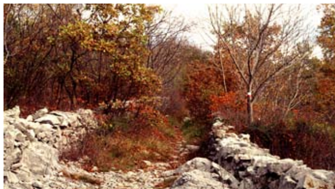
Il sentiero n° 3 "Alta Via del Carso" tra Monrupino e il valico di Comeno.

L'11 novembre andremo nelle Prealpi Giulie: tra le valli del Torre e del Cornappo si estende l'altopiano della Bernadia cosparso di cavità carsiche e punto panoramico verso la pianura friulana e il mare. In giornate particolarmente terse la vista